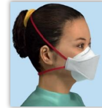
Atemschutzmaske mit Ventil